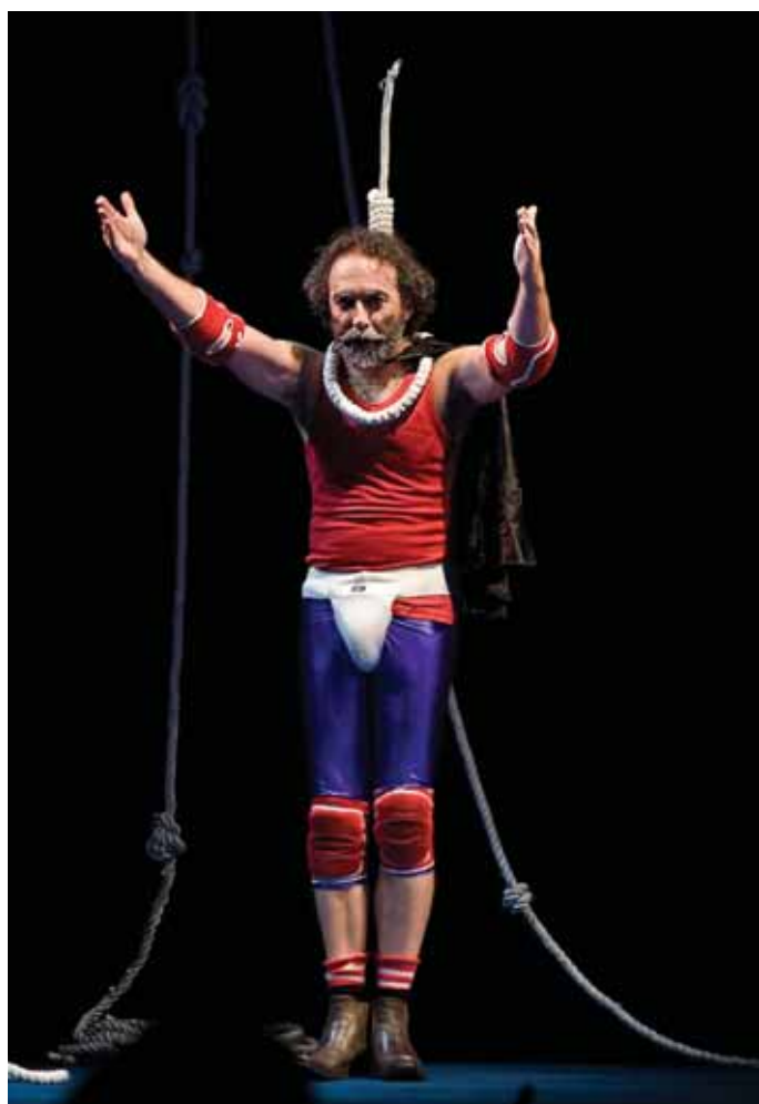
Escena de Colgados.